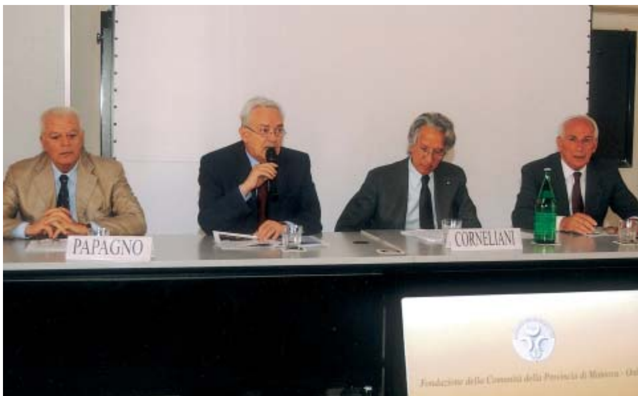
■ MANTOVA, Convegno annuale della Fondazione tenutosi il 24/05/2003, il tavolo dei relatori.

La Fondazione della Comunità di Mantova appartiene a tutti i mantovani, è di ciascuno di noi, tutti dobbiamo sentircela nostra, è una realtà che aumenta ogni giorno di più la sua importanza ed utilità non solo in riferimento al presente ma sempre più per il futuro, per cui si materializza un nuovo patto di solidarietà fra le generazioni, e ciò è uno dei fondamenti e presupposti su cui è stata costruita la nostra civiltà occidentale.